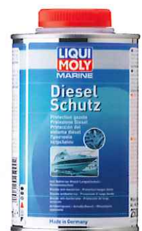
Art.-Nr. 25000, 500 ml

Für größere Boote oder erhöhten Bedarf sind außerdem die Art.-Nr. 25000 und 25002 mit Messbecher für exakte Dosierung erhältlich. 500 ml sind bei vorbeugender Anwendung ausreichend für bis zu 500 l Dieselkraftstoff, 1 l ist bei vorbeugender Anwendung ausreichend für bis zu 1000 l Dieselkraftstoff.