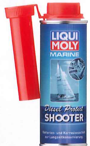
Art.-Nr. 25099, 200 ml

Frei verkäuflich auch an Endkunden, geprüfte Wirksamkeit nach ASTM E 1259-10