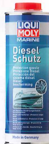
Art.-Nr. 25002, 1 l

Ein Stahlprüfkörper wird nach DIN ISO Norm über 24 Stunden in eine Mischung aus unadditiviertem Testbenzin und Wasser getaucht, ein zweiter unter den gleichen Bedingungen in eine Mischung aus additiviertem Testbenzin und Wasser. Nach Testabschluss wird die Korrosion optisch sichtbar.